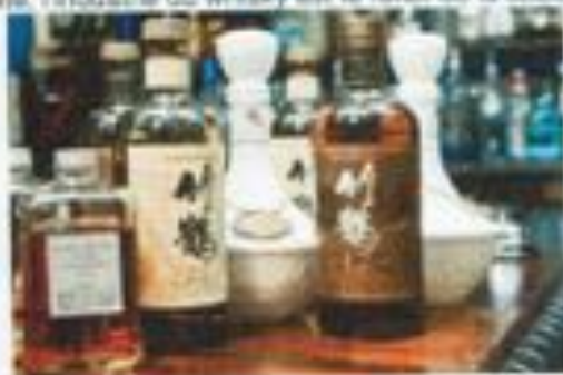
Nikka - From The Barrel Tokatone, Tsuru Ceramic

D'autre part, le whisky de grain est toujours élaboré à partir de maïs. En Ecosse, le maïs a été progressivement remplacé par le blé. Même s'ils sont attachés à la tradition, les producteurs de whisky japonais n'hésitent pas à innover. Ainsi le Nikka from the Barrel est un blend fort degré (51,4% vol.) affiné dans des fûts de bourbon de premier remplissage. Au final, les blends japonais se révèlent légers. Pour autant ils ne manquent pas de caractère. Ils regorgent de notes fruitées et vanillées. Oscillant entre tradition et modernité, l'industrie du whisky est le reflet de la société japonaise.