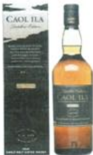
CAOL ILA Distillers Edition 43% Single Malt, Ecosse / Islay 70cl

Caol Ila est le nom gaélique du «Sound of Islay», le bras de mer qui sépare l'île d'Islay de sa voisine, Jura, dans l'une des régions les plus sauvages et les plus belles de la côte occidentale écossaise. Cette distillerie donne naissance au plus moelleux des malts d'Islay, reconnaissable entre tous à ses notes d'huile d'olive, de fumée, de fruits et à sa fraîcheur marine. Les fûts de Moscatel sélectionnés pour sa seconde maturation confèrent à cette expression de Caol Ila une très belle délicatesse et une richesse aromatique remarquable.